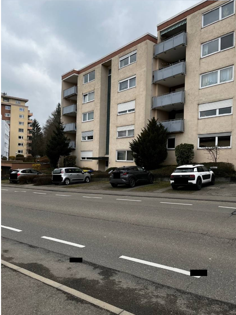
Objekt Außenansicht – Wohnung Nr. 17